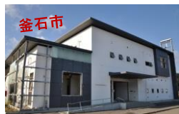
釜石市 震災遺構、名所等を語り部の解説を受けながら見学。