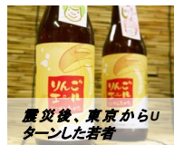
震災後、東京からUターンした若者 潮風を受けて育った米崎リンゴで作られた珍しい「りんごビール」を味わう。