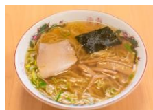
製鉄所の人がさっと食べられるように考案された「釜石ラーメン」を食す。