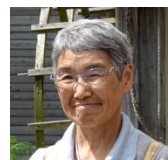
レストランで素朴な料理を味わう。また併設される公園は、震災で子どもの遊び場が不足していることを憂い、休閑農地を開放し、手作りの公園を制作！