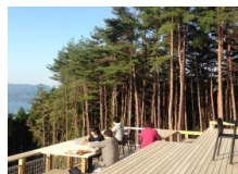
まちを一望できるテラス、気仙杉がふんだんに使われた客室で訪問客の心を癒やす。