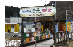
東北沿岸部と言ったら海鮮♪被災店主が手を取り合って奮闘する未来商店街でお寿司を食す。