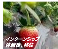
震災後、雇用をつくろうと苺や菊の栽培や収穫体験等を実施し インターンシップ体験後、移住