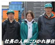
社長の人柄にひかれ移住 鮭の養殖発症の地。被災から再建までの状況をきき、施設の見学。地域の魅力を伺う。