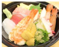
いくら、鮭、ウニなど、四季の食材でできらめく、名物「南三陸キラキラ丼」を味わう。