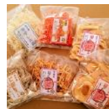
高齢者も誰も働くことのできるまちづくりに挑戦！福祉作業所の見学。