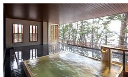
もしもの時に即座ににげることのできる津波対策用避難階段の設置を計画。通常時は、ひな壇観覧席として地域活性化に活用