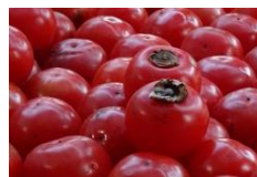
トマトのような珍しい柿「甲子柿」。これを継承するために、加工商品化や販売等の取組を進める。