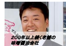
200年以上続く老舗の味噌醤油会社 強い信念と行動力で、社員を一人も解雇することなく再建！味噌を使ったお菓子の試食も♪