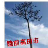
陸前高田市 震災遺構など、語り部の解説を受けながら見学。