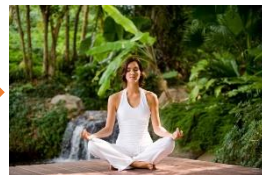
⑫絶景の青空ヨガで心も体も元気に