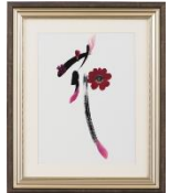
⑥押し花ボタニックアート体験。俱知安の草花から新たな日本文化を発見。