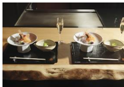
⑨地元食材を使った夕食を堪能