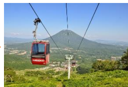
③ランチの後はサマーゴンドラで一気に標高820Mへ