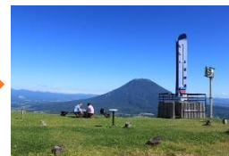
④見渡す限りの素晴らしい景色を写真に