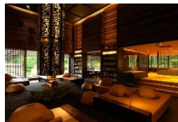
⑦隠れ家的和風モダン温泉旅館へ