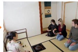
⑬茶道の日本文化体験。まごころこもった和菓子を堪能。日本文化、ニセコの魅力を感じる旅の終わり...