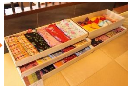
⑩色浴衣で日本文化体験