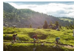
⑤日本初のフロートレイルアクティビティを体験。まるでヨーロッパのような絶景を眺めながら爽やかに。