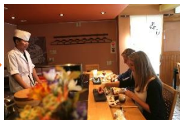
②日本料理店で職人技と寿司を堪能。日本海まで車で30分、海の恵みに感謝。