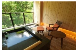
⑧自分たちだけの極上の温泉に感動