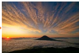
⑪日の出とともに雲海から頭を出す“えぞ富士羊蹄山”